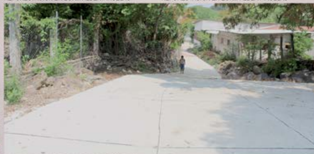
PAVIMENTACION DE CALLE ALDEA PIÑUELAS