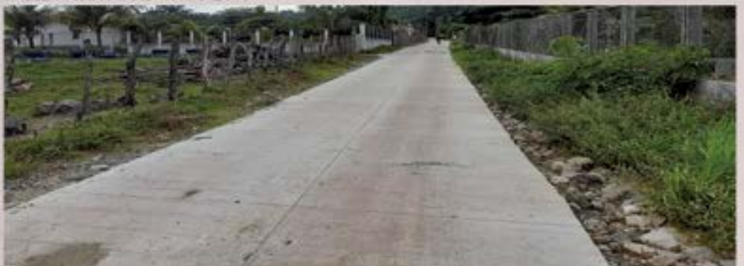
PROYECTO DE PAVIMENTACION EL DORADOR; MUNICIPALIDAD APORTO LOS MATERIALES Y LA COMUNIDAD LA MANO DE OBRA