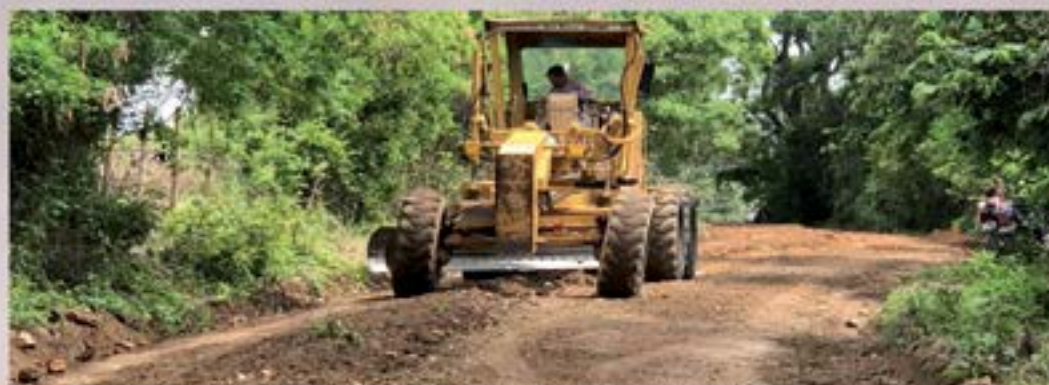
CONVOY MUNICIPAL REALIZO MEJORAMIENTO DE CALLE EN ALDEA SANTA BARBARA