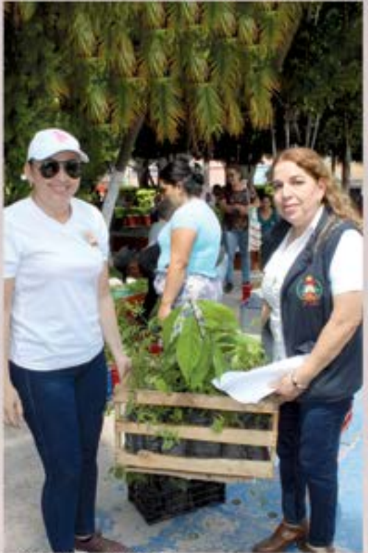
ENTREGA DE ARBOLES