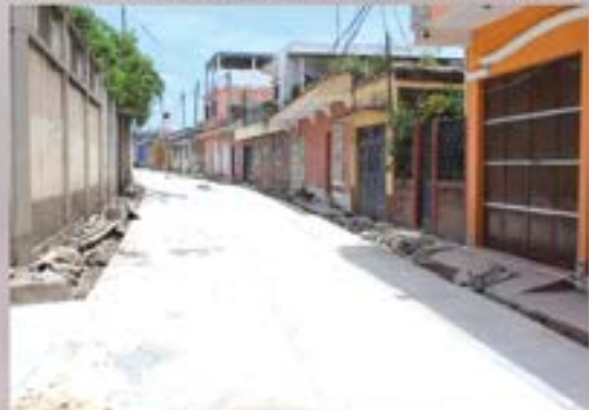
PAVIMENTACION BARRIO EL CENTRO.