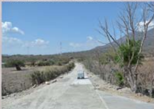
PAVIMENTO ALDEA EL CHILE