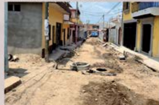
MEJORAMIENTO DE SISTEMA DE ALCANTARILLADO