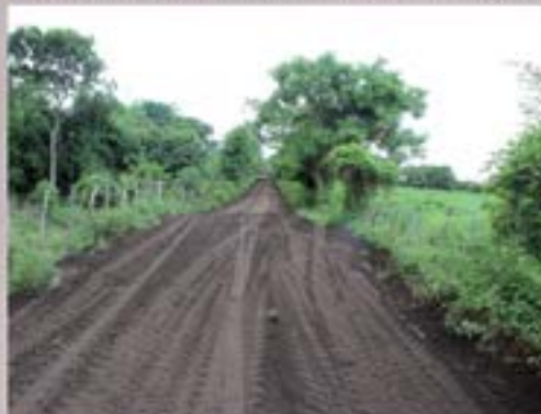
MEJORAMIENTO DE CALLE DE LA COMUNIDAD EL DORADOR HACIA CERRO GORDO