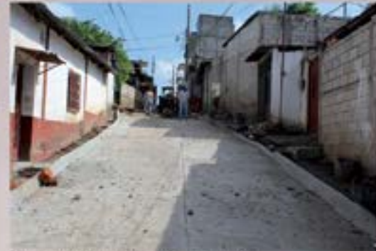
PAVIMENTACION BARRIO EL ALTILLO