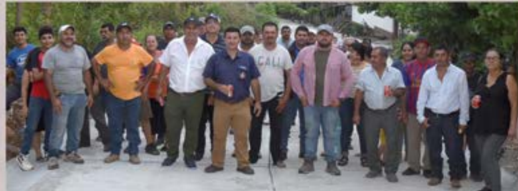
PAVIMENTO CUESTA ESTACION PAPALHUAPA