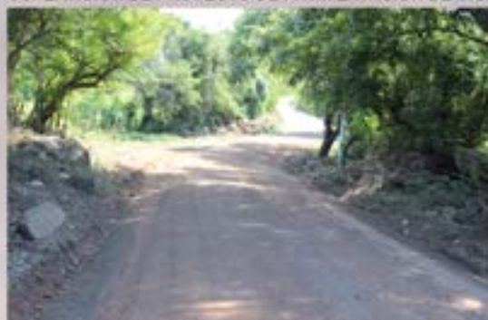
MEJORAMIENTO CALLE HACIA EL OBRAJUELO.