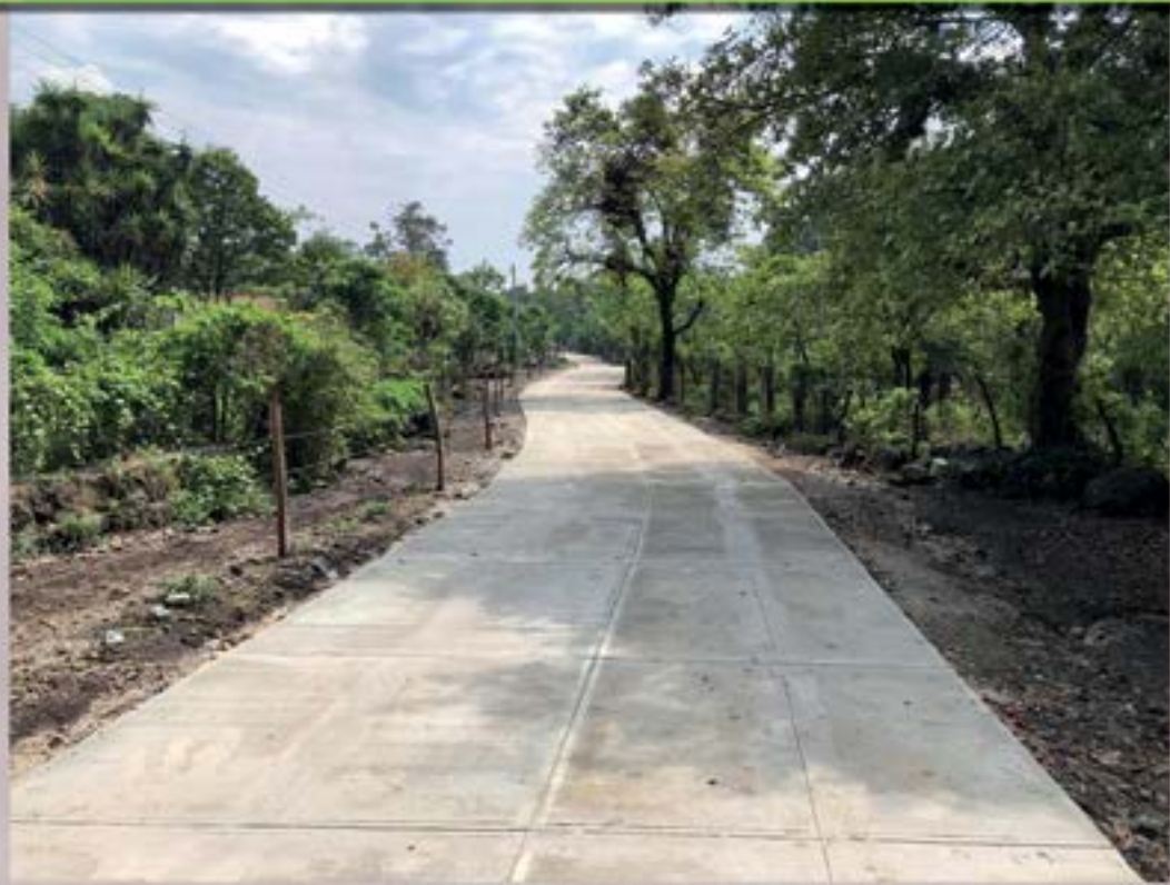
PAVIMENTACION ALDEA LA PARADA