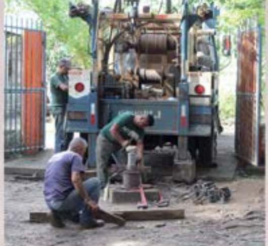
INSTALACION DE NUEVO MOTOR Y BOMBA EN EL POZO DEL OJO DE AGUA (40 CABALLOS DE FUERZA)