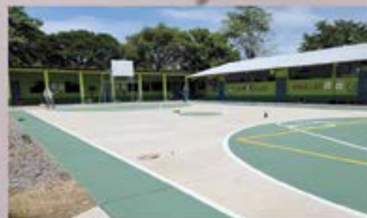
CANCHA EORM PIÑUELAS