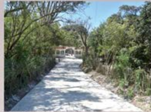
PAVIMENTO CAÑAS ABAJO