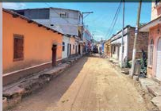
BASE PREVIO A LA PAVIMENTACION BARRIO EL CENTRO.