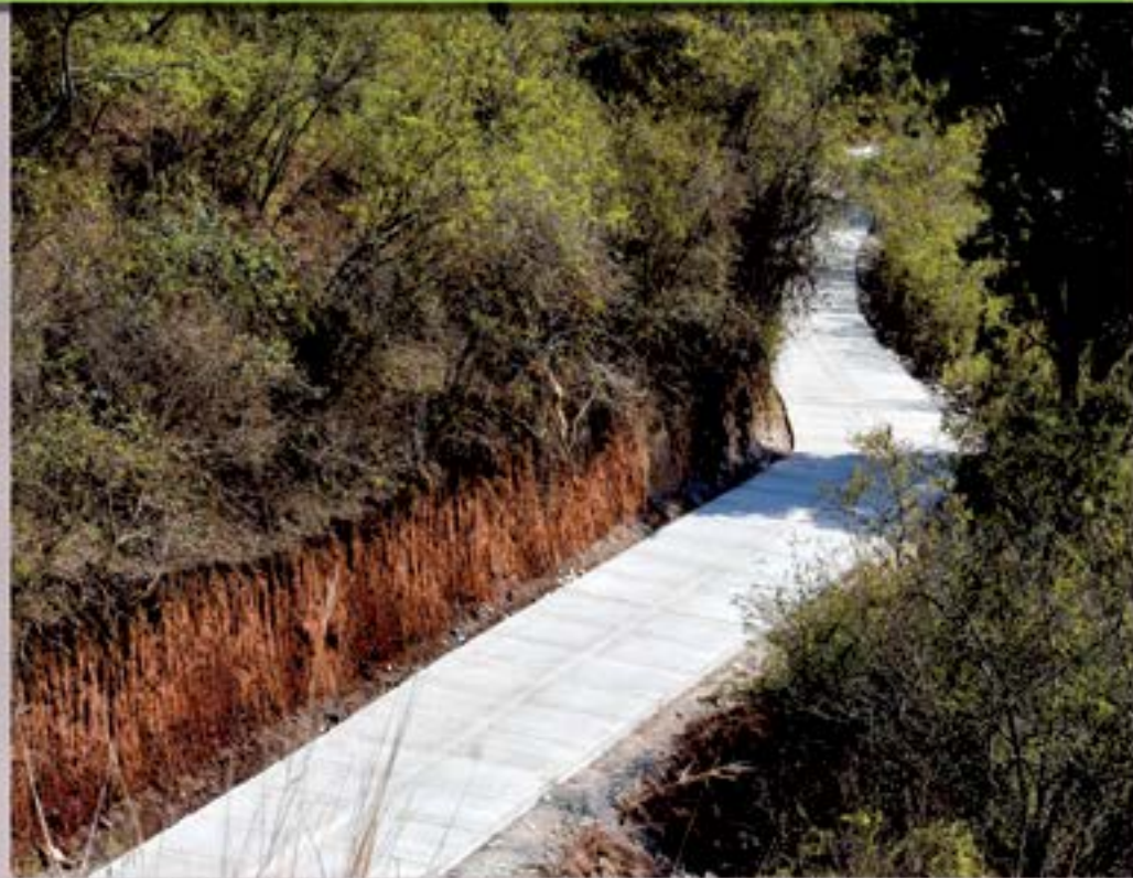
PAVIMENTO A LAGUNA OBRAJUELO

EL PAVIMENTO REALIZADO EL PRESENTE AÑO PARA LAGUNA DE OBRAJUELO, ES SIN DUDA EL PAVIMENTO MAS LARGO QUE SE HA REALIZADO HASTA EL DIA DE HOY EN AGUA BLANCA, BENEFICIANDO A TODAS LAS PERSONAS QUE TIENEN PROPIEDADES EN EL SECTOR, ASI COMO TAMBIEN A TODOS LOS VISITANTES DE NUESTRA HERMOSA LAGUNA, ES UN SUEÑO HECHO REALIDAD SEGUN ALGUNOS VECINOS, QUE NUNCA PENSARON QUE UN PROYECTO DE ESA NATURALEZA SE FUERA A HACER EN DICHO SECTOR.