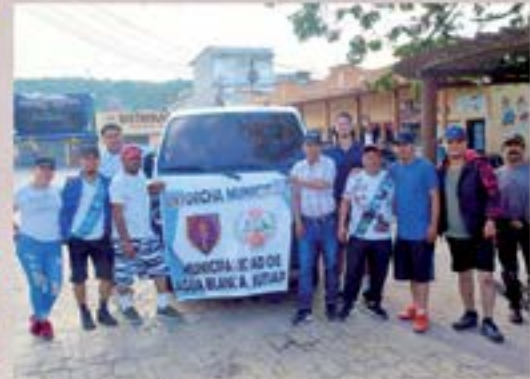
APOYO ANTORCHA 15 DE SEPTIEMBRE