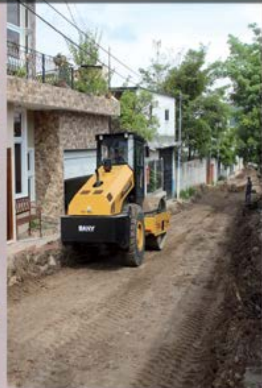
PROYECTO DE MEJORAMIENTO DE SISTEMA DE ALCANTARILLADO Y PAVIMENTACION BARRIO LA FEDERAL