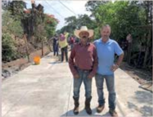
PAVIMENTO LA PARADA