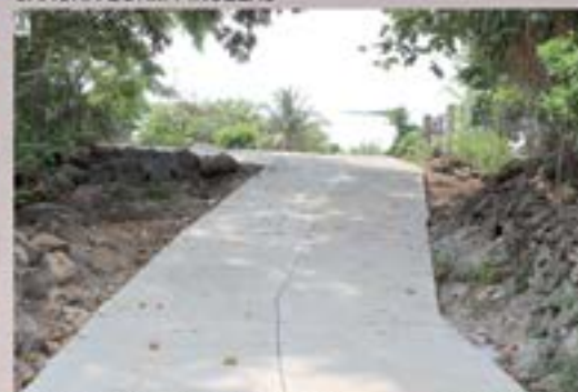
SUPERVISION DE PAVIMENTACION DE CALLE ALDEA PIÑUELAS