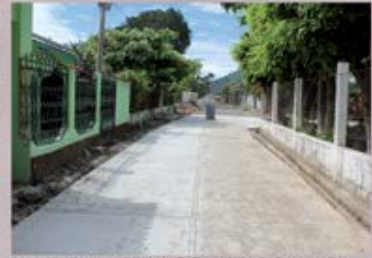
PAVIMENTACION DE CALLE EN ALDEA PAPALHUAPA

Pavimento aldea Papalhuapa, cabe mencionar que la municipalidad hizo un tramo completo con maquinaria para la realización de la base, 600 bolsas de cemento, arena, piedrin, mano de obra, anti sol, así también la comunidad aportó 800 bolsas de cemento para el tramo extra, poniendo la municipalidad siempre maquinaria para la realización de la base, arena, piedrin, mano de obra, anti sol.