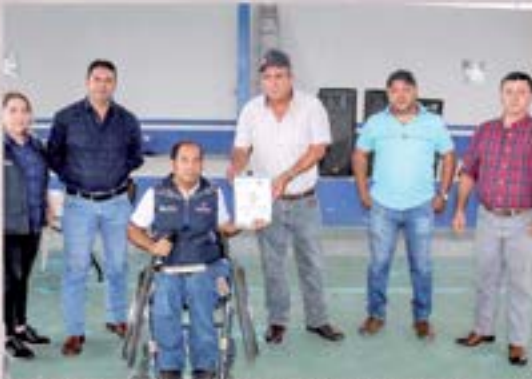
ENTREGA DE POLITICA PREVENCION DEL DELITO