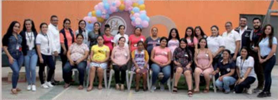
CELEBRACION BABY SHOWER POR EL CENTRO DE SALUD CON APOYO DE LA MUNICIPALIDAD DE AGUA BLANCA