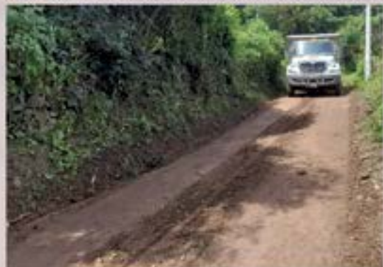
CONVOY MUNICIPAL REALIZO MEJORAMIENTO DE CALLE HACIA PINAL Y PANALVIA