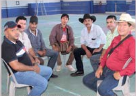
REUNION CON COCODES SECTOR MONTE RICO