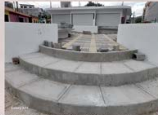
Construcción Parque Tres Barrios.