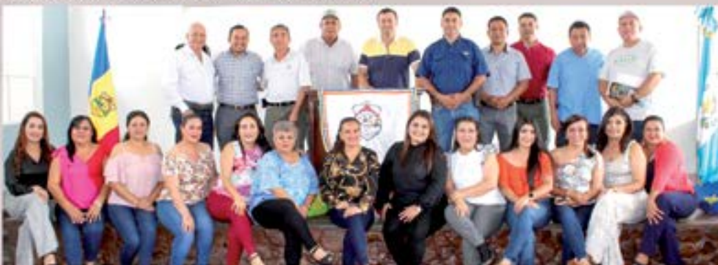
Entrega Diplomas apoyo reconstrucción Escuela de Parvulos.