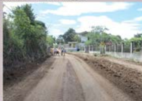
BASE PREVIO A LA PAVIMENTACION ALDEA LA TUNA.