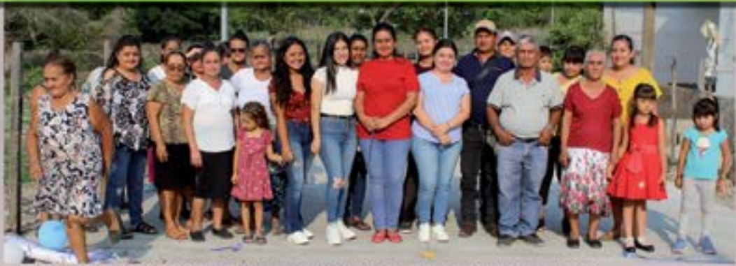
ENTREGA DE PROYECTO DE PAVIMENTACION DE CALLE EN BARRIO EL LLANO