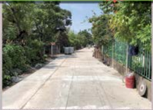
SUPERVISION DE PAVIMENTACION ALDEA LA PARADA