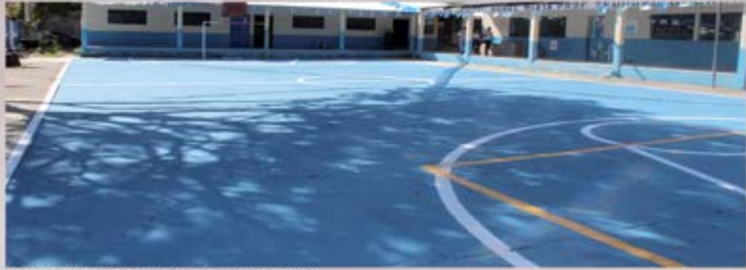
PINTADA DE CANCHA DE EORM ALDEA PAPALHUAPA