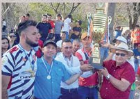
PREMIACION CAMPEONATO LAS CAÑAS