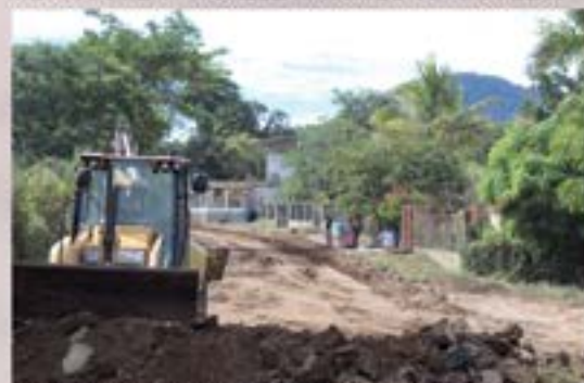
BASE PREVIO A LA PAVIMENTACION ALDEA LA TUNA.