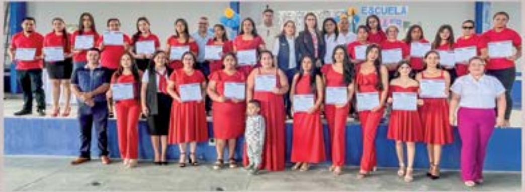
ACTO DE CLAUSURA DE CURSO CORTE Y CONFECCION, ENTREGA DE DIPLOMAS POR LA DMM Y PROGRAMA NACIONAL ESCUELAS TALLER, ESTO EN SALON BARRIO LAS CASITAS