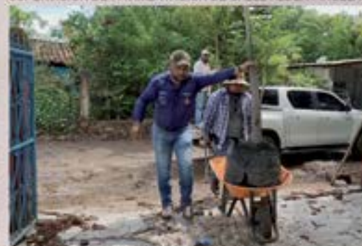
REFORESTACION EN EORM ALDEA PIÑUELAS