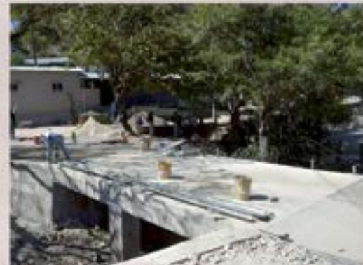
PUENTE CAÑAS ABAJO