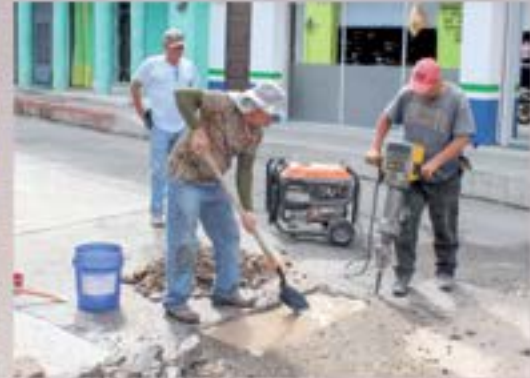
arreglo de sistema agua potable