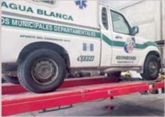
APOYO CON LLANTAS A BOMBEROS