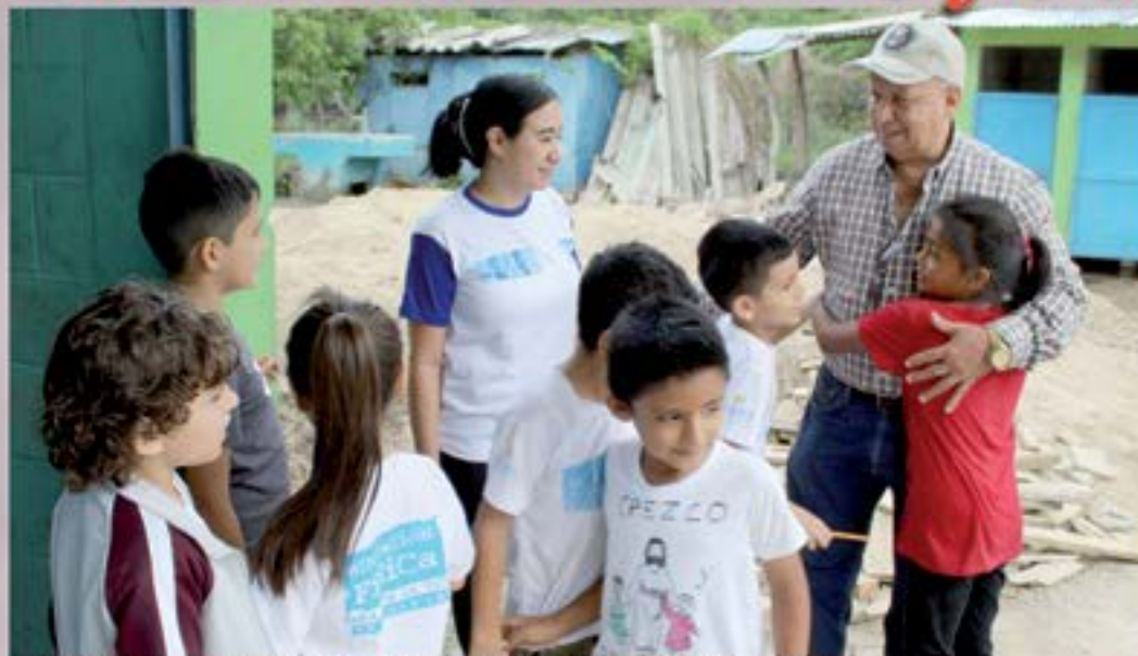
SUPERVISION DE PROYECTO DE PAVIMENTACION DE INGRESO Y CANCHA EORM PIÑUELAS