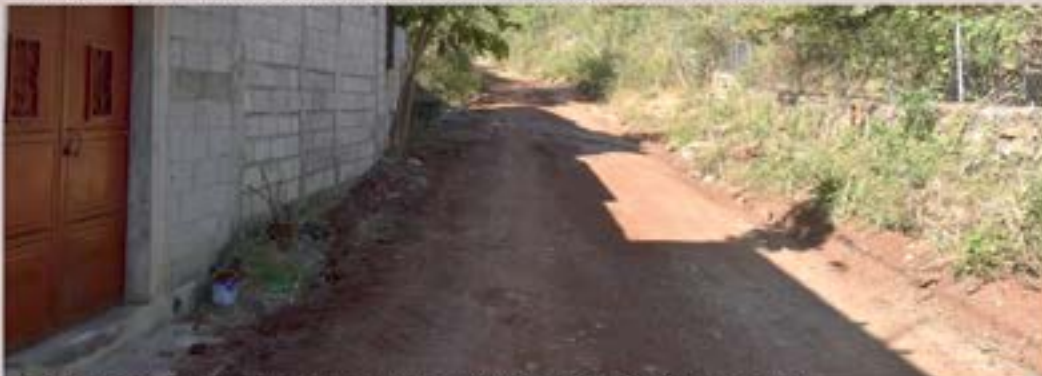
mejoramiento calle que une barrio El Altillo y Barrio Ojo de agua