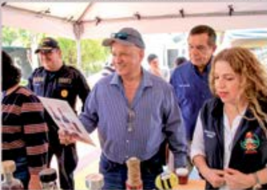
festival gastronomico, Municipalidad de Agua Blanca