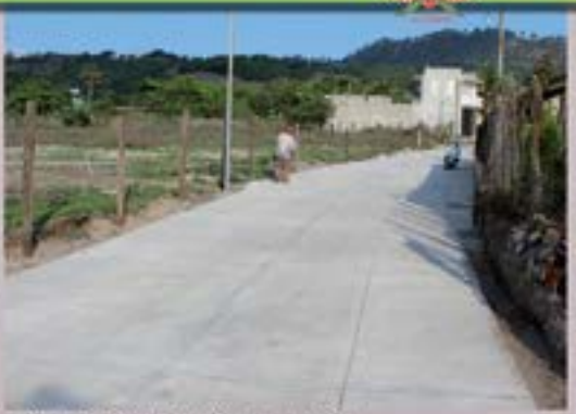
CALLE EN BARRIO EL LLANO