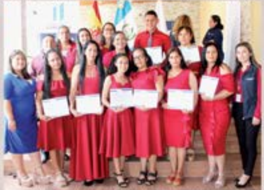
CERTIFICACION DE FORMACION LABORAL DE LOS JOVENES DE ESCUELA TALLER