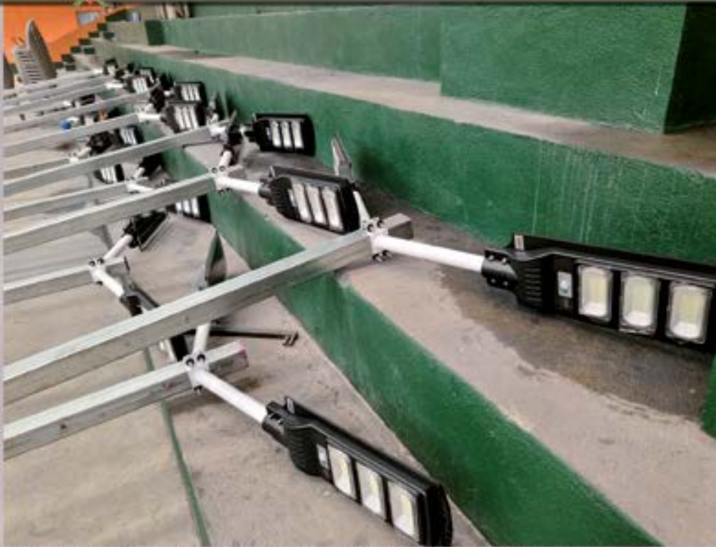
AMPLIACION DE ALUMBRADO PUBLICO MEDIANTE COLOCACION DE LAMPARAS SOLARES LED