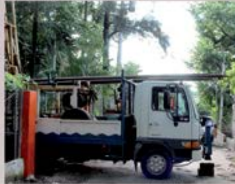
colocacion de bomba nueva pozo Ojo de Agua