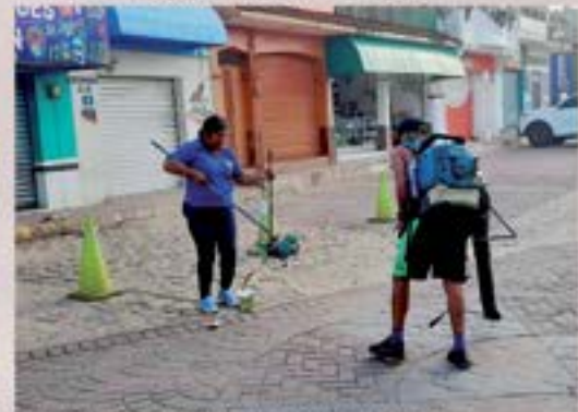
TREN DE ASEO LIMPIADO PLAZA CENTRAL