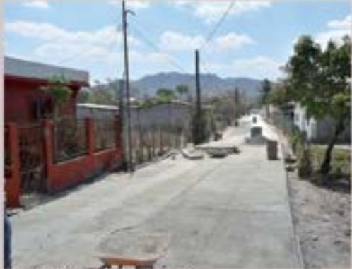
PAVIMENTO LAS CASITAS