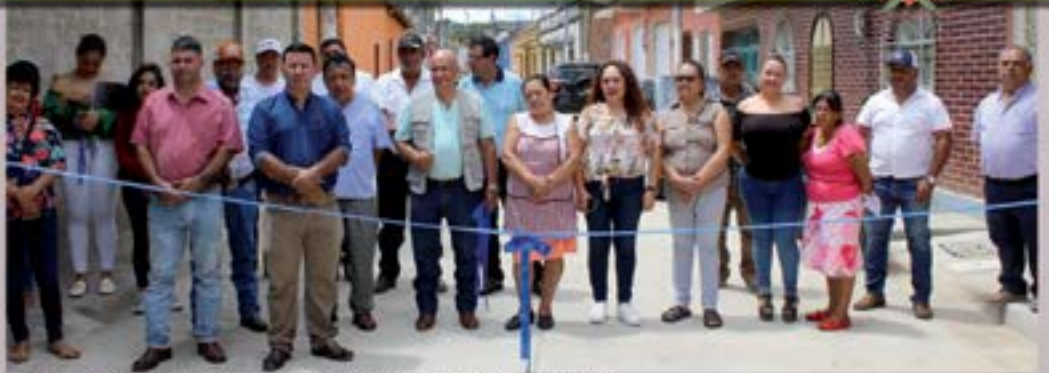
ENTREGA DE PAVIMENTACION BARRIO EL CENTRO, AGUA BLANCA