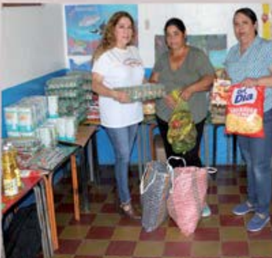
DMM Y SOSEP ENTREGAN VIVERES A MADRES DE NINOS CASA CADI