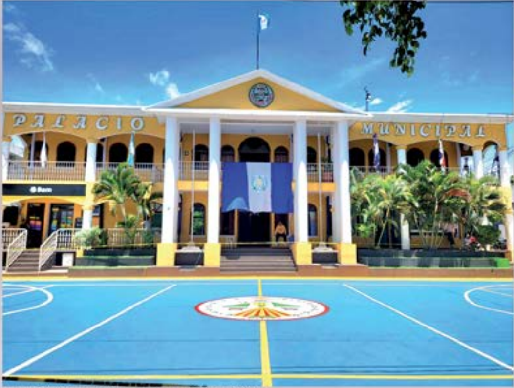
PINTURA CANCHA FRENTE AL PALACIO MUNICIPAL