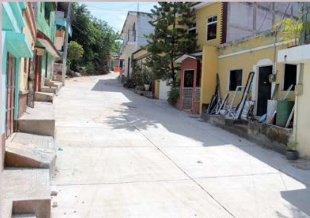
PROYECTO DE MEJORAMIENTO DE SISTEMA DE ALCANTARILLADO Y PAVIMENTACION BARRIO EL ALTILLO