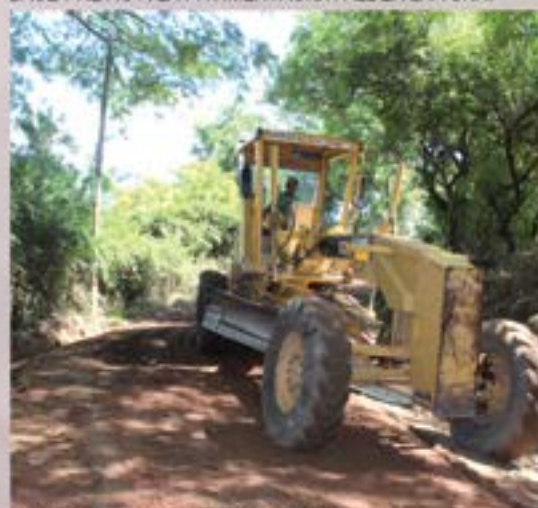
MEJORAMIENTO CALLE HACIA EL OBRAJUELO