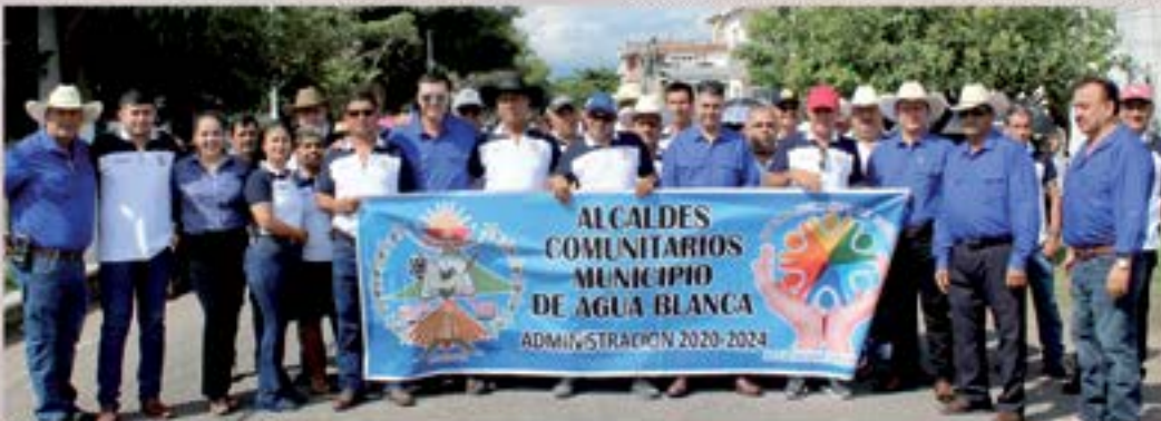
DESFILE 15 DE SEPTIEMBRE