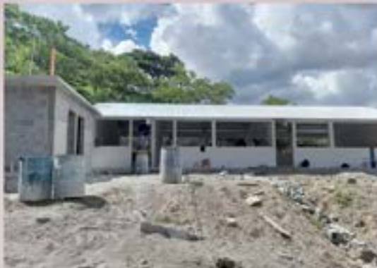
CONSTRUCCION ESCUELA RANCHO DE CUERO