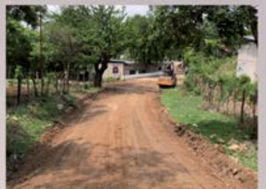
MEJORAMIENTO DE CALLE EN ALDEA SANTA BARBARA