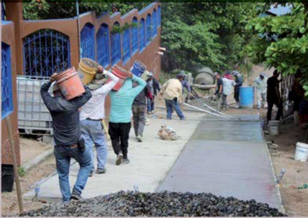
CALLE EN ALDEA PAPALHUAPA

Pavimento aldea Papalhuapa, cabe mencionar que la municipalidad hizo un tramo completo con maquinaria para la realización de la base, 600 bolsas de cemento, arena, piedrin, mano de obra, anti sol, así también la comunidad aportó 800 bolsas de cemento para el tramo extra, poniendo la municipalidad siempre maquinaria para la realización de la base, arena, piedrin, mano de obra, anti sol.