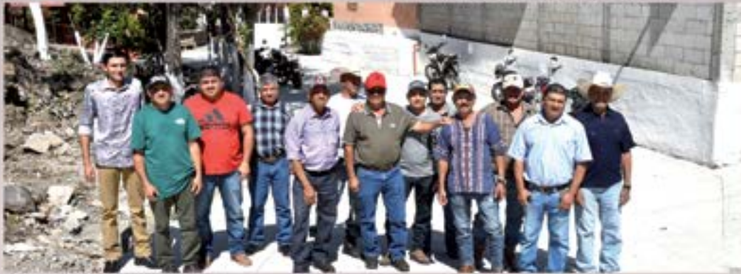
PAVIMENTO BARRIO ARRIBA