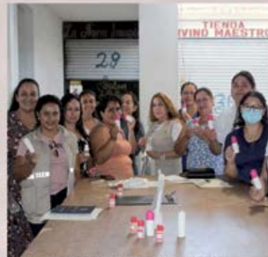
DMM Y SOSEP IMPARTIERON TALLERES