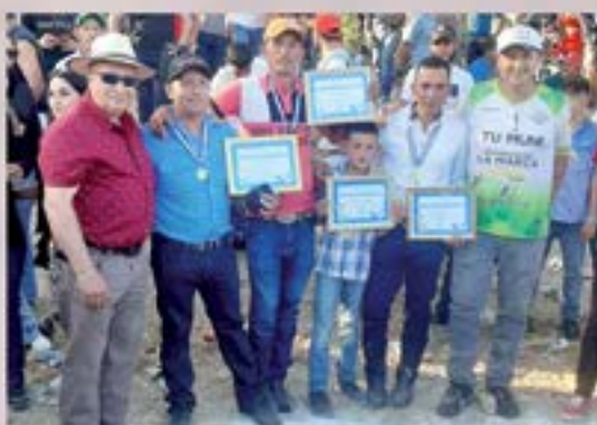
PREMIACION CAMPEONATO LAS CAÑAS