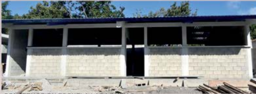
CONSTRUCCION ESCUELA LAS LOMITAS