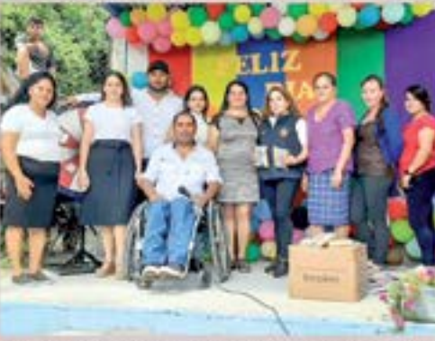
capacitacion comunidades Vice Ministerio de Gobernacion