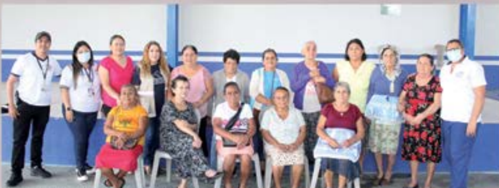
CAPACITACIONES A COMADRONAS