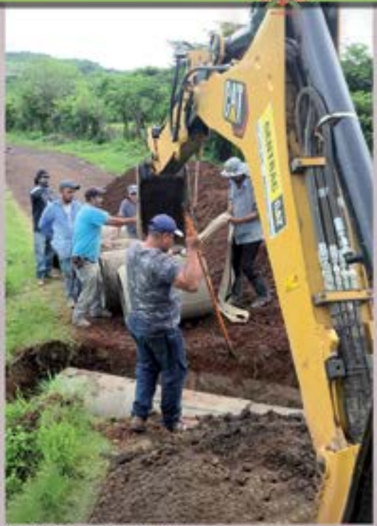
INSTALACION DE TUBERIA DE CONCRETO PARA DESAGUE DE AGUAS LLOVEDIZAS CALLE DE SAN PATRICIO AL TEMPISQUE