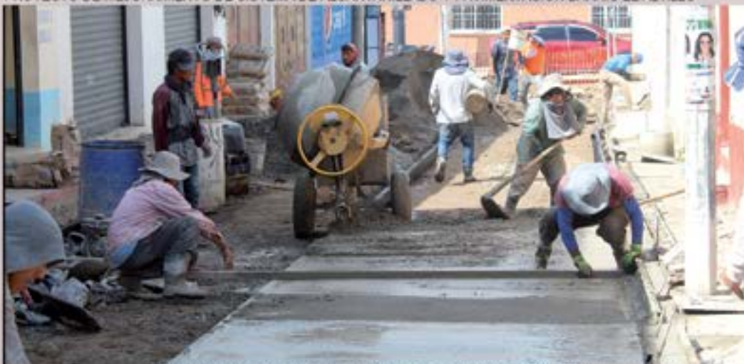
PROYECTO DE MEJORAMIENTO DE SISTEMA DE ALCANTARILLADO Y PAVIMENTACION BARRIO EL ALTILLO