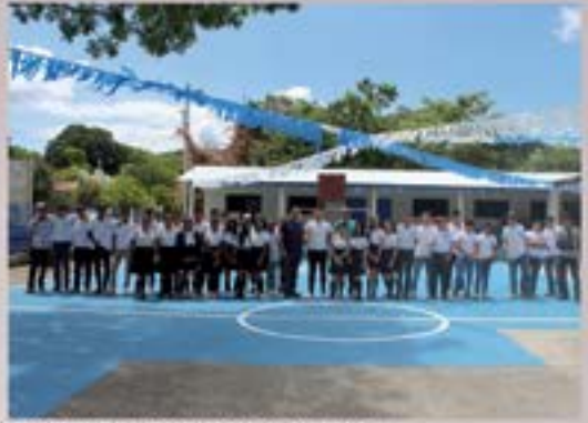
CANCHA DE EORM ALDEA PAPALHUAPA