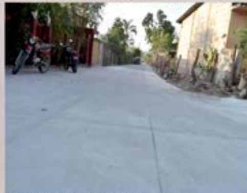
PAVIMENTO LA FELICIDAD