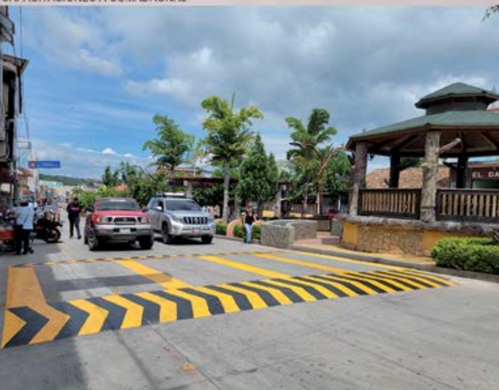
PERSONAL MUNICIPAL REPINTAN TUMULOS