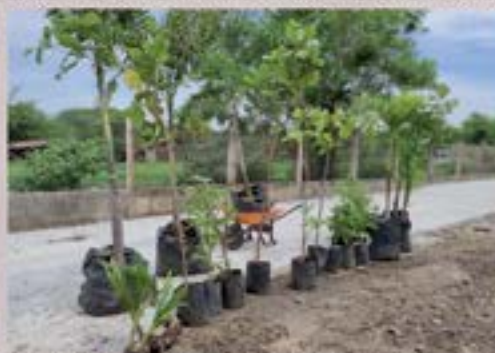
REFORESTACION EN EORM ALDEA PIÑUELAS