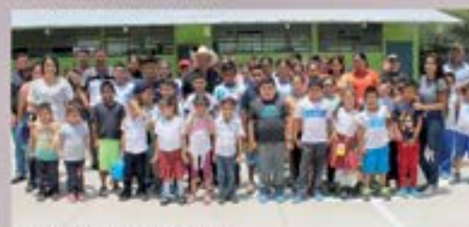
CANCHA EORM PIÑUELAS